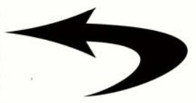
illustration Nadja Pebremand

Pliez vers l'intérieur en suivant les pointillés